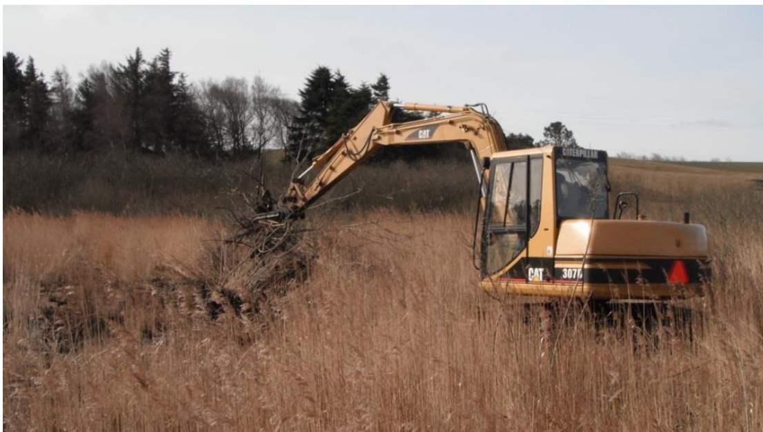
Figur 3: Oprydning af piletræer i rigkæret Hellerød Kær.

Naturstyrelsen har gennemført 12 indsatser i dette Natura 2000 område i perioden 2009-2015. Disse indsatser består af en række plejetiltag på et areal der udgør i alt 575 ha. Disse indsatser har bidraget positivt til opfyldelse af Natura 2000-planens målsætninger og har været til gavn for arter og naturtyper på udpegningsgrundlaget. En mere konkret redegørelse af Naturstyrelsens indsats kan ses på Naturstyrelsens hjemmeside .