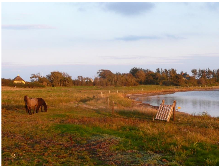
Figur 6: Ny hegned strandeng på Jegindø.