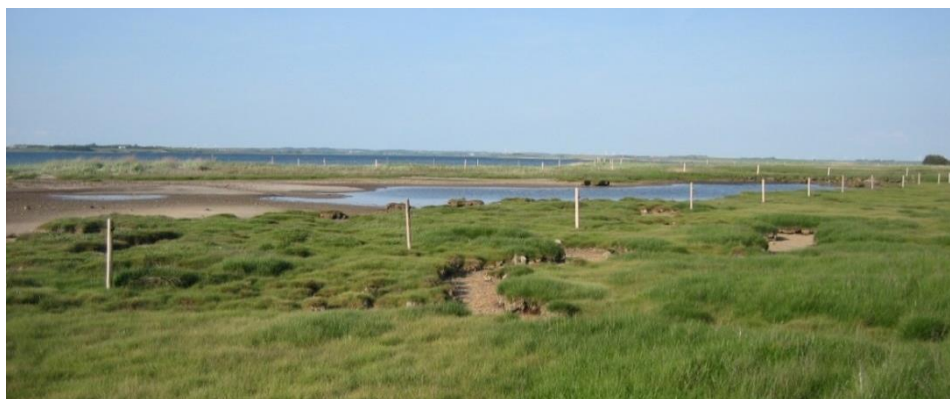
Figur 7: Afgræsset strandeng Munkholm.

Projekterne gennemføres ved frivillige aftaler, og derfor er det i mange tilfælde ikke på nuværende tidspunkt muligt at beskrive hvornår projekterne fysisk bliver udført. Kommunen vil i hvert enkelt tilfælde sørge for, at relevante interessenter bliver inddraget, fx forventer Morsø Kommune at afholde et lodsejermøde i 2017, som opstart på et hegnsprojekt.