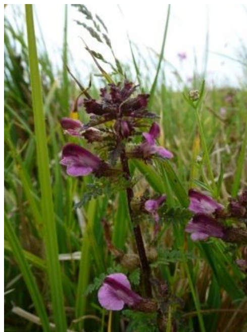
Figur 5: Engtroldurt.