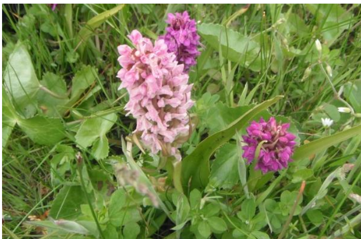
Figur 4: Orkideer i Hellerød Kær.

* Tallene i dette tekststykke omfatter ikke offentlige arealer, hvor ejeren gennemfører Natura 2000-planen i egne drifts- og plejeplaner.