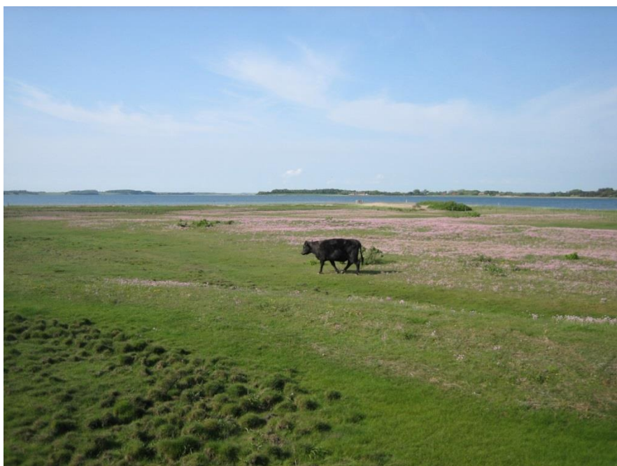
Figur 2: Strandeng ved Tambosund.

Den kommunale Natura 2000-handleplan er som udgangspunkt omfattet af krav om miljøvurdering i henhold til lov om miljøvurdering af planer og programmer (lovbekendtgørelse nr. 1533 af 10. december 2015). Kommunerne har miljøscreenet forslaget til Natura 2000-handleplan og truffet afgørelse om, at der ikke skal udarbejdes miljøvurdering, da planerne vurderes ikke at have en negativ eller væsentlig indvirkning på miljøet. Kommunerne har forhørt berørte myndigheder forud for afgørelsen.